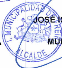
JOSÉ ISAFOR BRAVO BURGOS ALCALDE MUNICIPALIDAD FREIRE